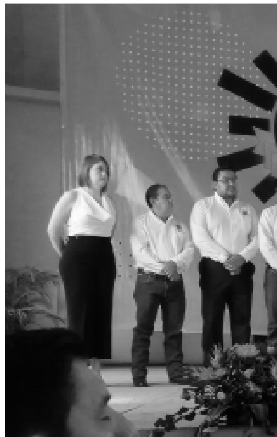
Dirigencia perredista. Mensajes.

Un video rememora los primeros años de existencia del partido que aglutinó a la izquierda de la entidad a inicios de la década de 1990 y la lucha popular por conquistar espacios de poder público. Hay entrevistas con líderes comunitarios, con los primeros militantes en integrarse, con un integrante del movimiento gay que ha encontrado espacio de representación