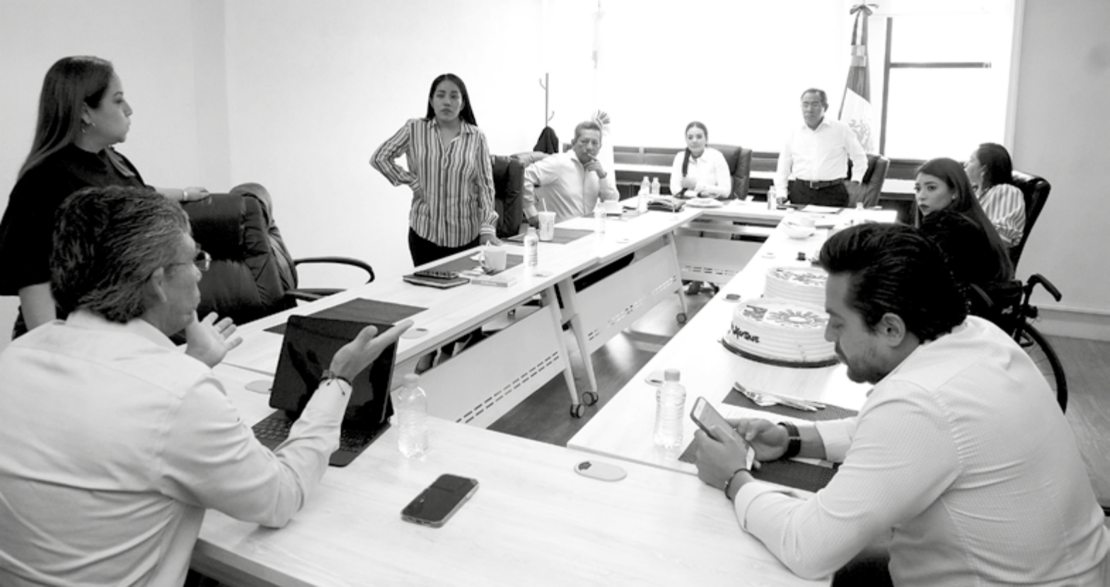
Fracción parlamentaria del PRD. Resultados.

dígenas y la participación para sacar la reforma al Código Penal para la interrupción del embarazo. Las demás iniciativas se están trabajando, para poder cumplir lo que marca la agenda.