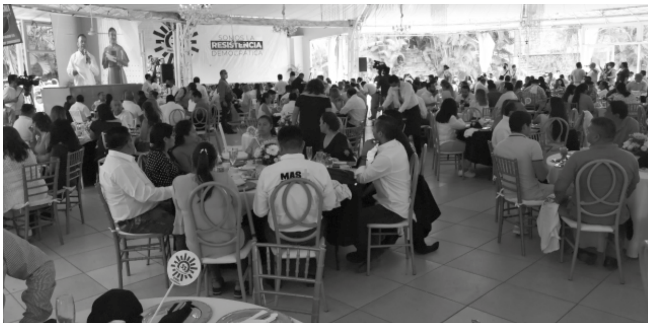
Militantes de las siete regiones de la entidad presentes en la conmemoración.

de los pueblos originarios y grupos vulnerables". Agregó que "se han cometido errores en este proceso histórico, los cuales se han convertido en continuos aprendizajes", a lo que añadiría: "No obstante, nuestra casa es su casa; sus luchas son las nuestras y les extendemos nuestra mano franca para converger nuevamente en la búsqueda de una sociedad justa e igualitaria", dirigiéndose a los integrantes de los movimientos sociales.